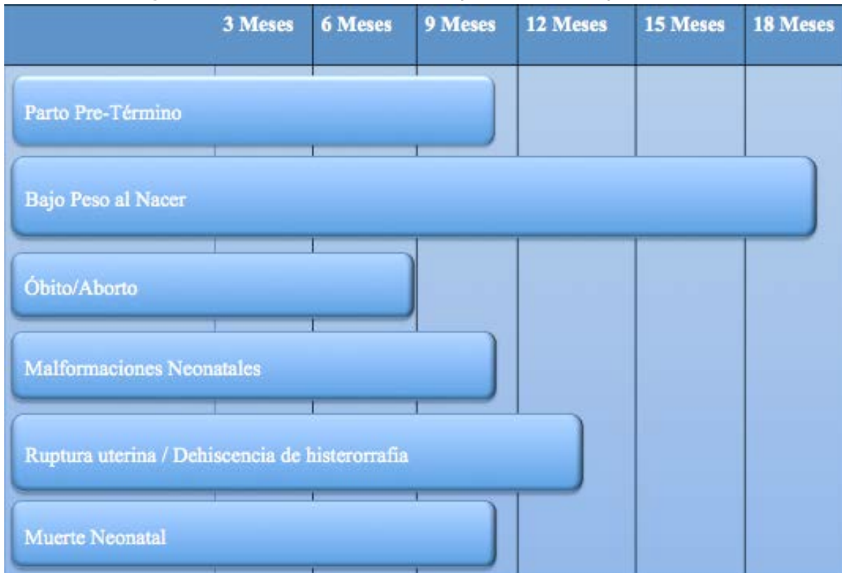
Figura 2. Eventos obstétricos adversos según el periodo intergenésico corto

Fuente: Marston, C. Report of a WHO technical consultation on birth spacing. World Health Organization, 2005; 1-37.