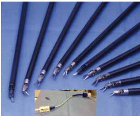
Figura 4. Pinzas robóticas y movilizador uterino.