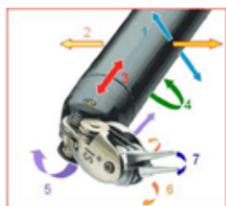
Figura 3. Sistema Endo Wrist y posibilidad de movimientos.