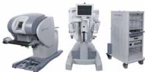
Figura 1. Consola maestra, robot esclavo y sistema de registro.