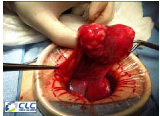
Figura 1. Trompa de Falopio derecha conteniendo un mioma de 8 centímetros en la porción media. Se aprecia la trompa alargada y se identifica la zona ístmica y ampular indemnes, a ambos extremos del mioma. El tumor contiene en su parte superior la pared de la porción media de la trompa sin lumen.

Sin embargo, existen diferentes teorías, para explicar el hallazgo de un mioma en lugares extrauterinos. Los de localización primaria podrían