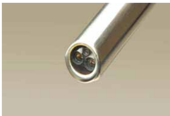
Figura 2. Óptica de 12 mm con doble cámara de 5 mm HD.

El instrumental robótico es similar al laparoscópico, pero presenta además un sistema de poleas llamado Endo Wrist (Figura 3), que le permite siete grados de libertad de movimiento, dos rotaciones axiales y cerca de 117.000 posibilidades de movimiento en tres planos. Existe una amplia gama de instrumental disponible (Figura 4).