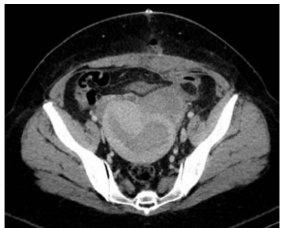
Figura 1. TAC abdominopélvico. Utero miomatoso. Imagen de masa anexial izquierda.

Al examen se aprecia una paciente con sobrepeso (IMC 29), que en el momento de la consulta presentaba un sangrado genital importante. Al tacto bimanual se objetiva una tumoración dura, fija, de unos 9-10 cm dolorosa al tacto que engloba todo el aparato genital interno y por ecografía se confirman los hallazgos del TAC. En la colonoscopia no se detecta ninguna lesión endoluminal y se visualiza una compresión extrínseca del sigma con mucosa normal. Los marcadores tumorales están alterados: Ca 12.5 de 73,3 U/ml; Ca 19.9 de 76 U/ml; HEA de 172 pmol/L; Ca 15.3 de 25,2 U/ml. El resto del estudio preoperatorio fue normal.