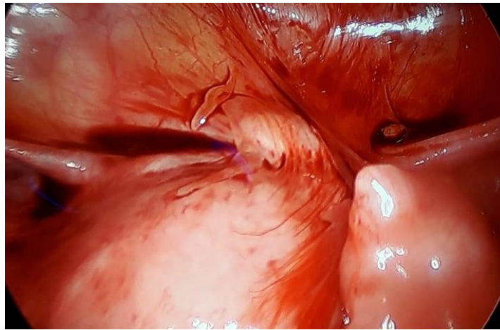
Figura 1. DIU (cabeza de flecha) fistulizado desde útero (flecha gruesa) a yeyuno (flecha delgada).